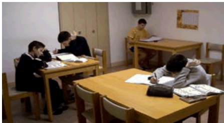
L'étude du soir