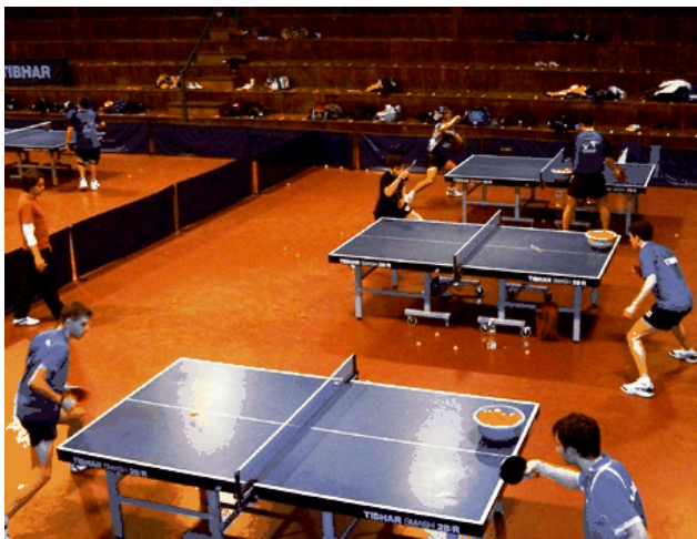
Le centre en pleine entraînement

Pour un panorama complet rendez-vous sur le site gvhht.com , rubrique centre de formation.